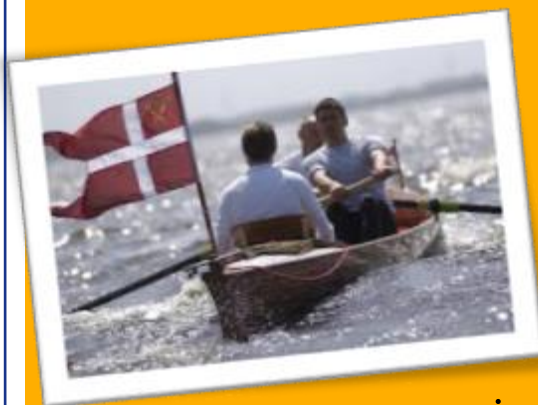
Roere fra en tidligere tur i frisk vind.

Hver dag gennemgås dagsdistancen på søkort med langtursstyr mændene.